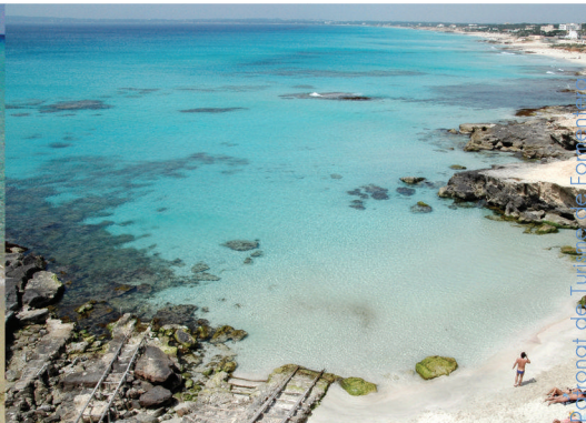
Patronat de Turisme de Formentera