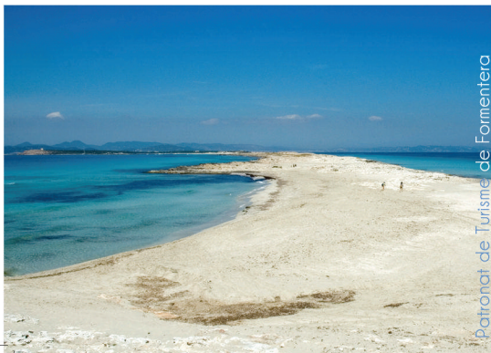
Patronat de Turisme de Formentera