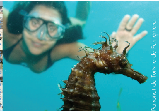
Patronat de Turisme de Formentera